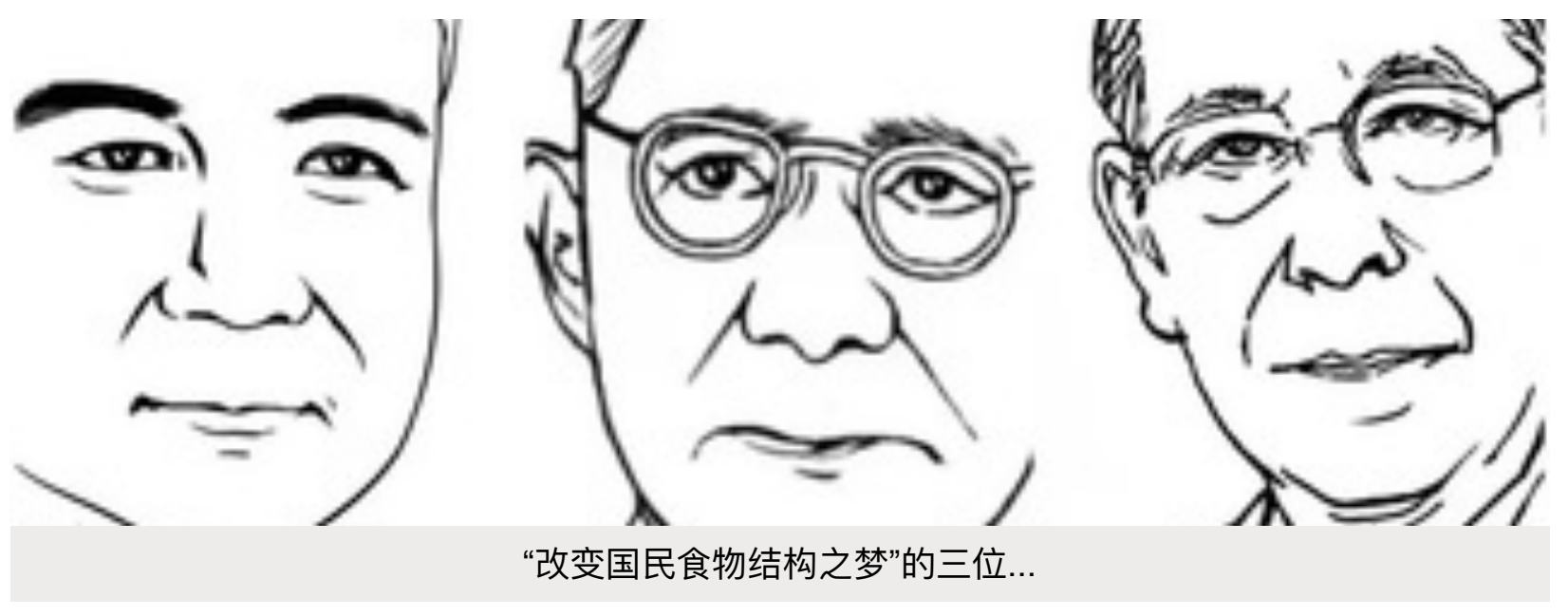
“改变国民食物结构之梦”的三位...